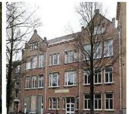
Kleine Gerrit (Moreelsestraat 19)