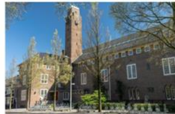
Gerrit van der Veenstraat 99

Onze school heeft vijf locaties. Naast de hoofdlocatie op de Gerrit van der Veenstraat 99, maken we gebruik van vier lokalen in de Albrecht Dürerstraat (in het rooster aangegeven als AD). Dat is direct om de hoek, boven de kinderopvang. Het vak muziek wordt grotendeels gegeven in de muziekschool in de Bachstraat en voor LO gaan leerlingen naar het VU Sportcentrum (in de winter) en naar de sportvelden van Swift op het Olympiaplein (in de zomer). Tot slot hebben we nog vijf klassen gehuisvest in het gebouw aan de Moreelsestraat 19. Dit noemen we het Kleine Gerrit .