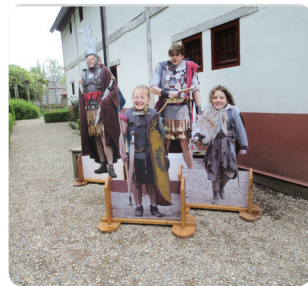
Welkom bij de Romeinen!

Bij de doe-tour kregen ze inzicht in het leven in de geschiedenis. Met een gids die uit het verleden leek gestapt bezochten ze huizen en gebouwen uit een verschillende periodes. Zo was er bijvoorbeeld het huis van de apotheker in de middeleeuwen. De leerlingen keken hun ogen uit en stelden veel vragen. En zoals een goede doe-tour betaamt, werd er vooral veel gedaan. Ze maakten armbandjes, draaiden kaarsen en leefden zich uit bij het favoriete onderdeel: het boogschieten.