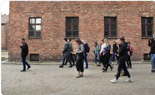
Vernietigingskamp Auschwitz, een plek waar alleen nog verbijsterd zwijgen past.

Met gebogen koppies bewandelen 24 vijfdeklassers met ingehouden adem de laatste meters van bijna 1 miljoen onschuldige slachtoffers. Vol ongeloof worden we keihard geconfronteerd met de geschiedenis. En dat is niet de enige keer dat ons dat tijdens deze buitenlandse reis naar Krakau zal overkomen