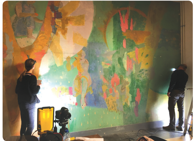
Met CSI-achtige nauwkeurigheid wordt de kwaliteit van het kunstwerk onderzocht

verschijning heeft de in de benedenhal geplaatste fresco na alle ellende wel een beetje verloren. Driewerf hoera dus, voor de studenten die al aan de reconstructie begonnen zijn, binnenkort wordt de wandschildering geres-taureerd en mogen we trots zijn op een fresco die ons op de geschiedenis van onze school wijst, maar dan met een hernieuwde allure waarmee we fris en voorjaarsachtig vol poëtisch genot de