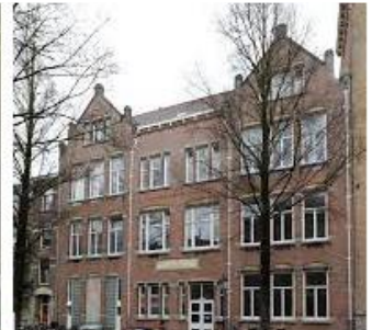
Kleine Gerrit (Moreelsestraat 19)