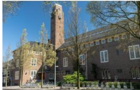
Gerrit van der Veenstraat 99

Onze school heeft vijf locaties. Naast de hoofdlocatie op de Gerrit van der Veenstraat 99, maken we gebruik van vier lokalen in de Albrecht Dürerstraat (in de volksmond AD). Dat is direct om de hoek. Voor muziek zitten we veel in de muziekschool in de Bachstraat en voor gym gaan leerlingen naar het VU Sportcentrum (in de winter) en naar de sportvelden van Swift op het Olympiaplein (in de zomer). Op de Moreelsestraat 19 hebben wij vijf klassen gehuisvest. Dit noemen we vanaf nu het Kleine Gerrit .